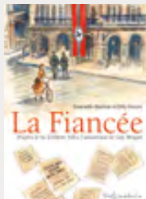
© Editions Soleil - Abolivier, Vaccaro

Rencontre-dédicace avec les auteurs Médiathèque intercommunale, 6 place Saint-Nicolas Châteaubriant