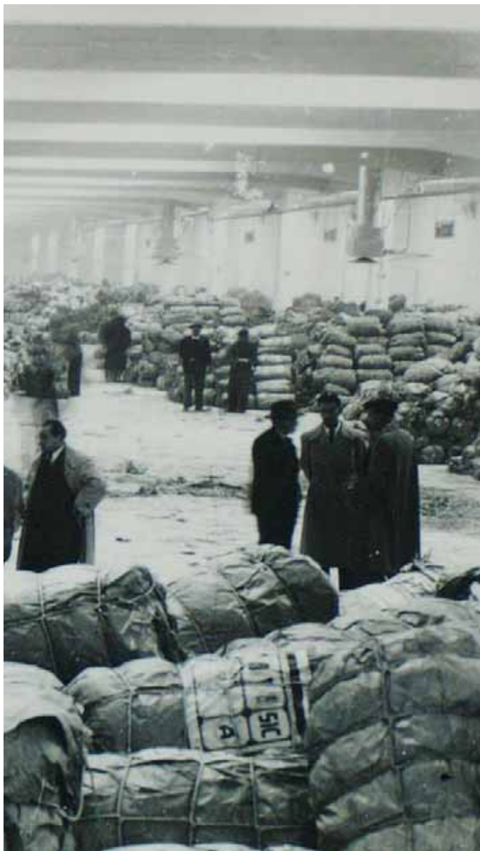
Le hangar où étaient entreposées les bananes venus de Guinée puis de Guadeloupe.