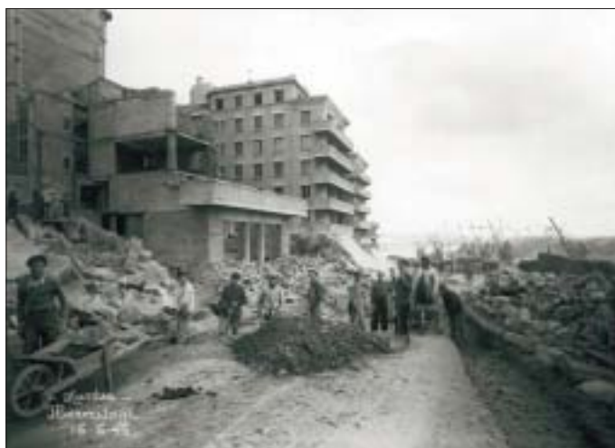
1946 : les ouvriers parent au plus pressé.

Habitante de la cité de l'Hermitage, Lucette Chapeau, 72 ans, a emménagé avec ses parents au premier étage du premier bâtiment, situé rue Chevalier-Thiercelin. "C'était en 1938 ou 1939, j'étais trop petite pour m'en souvenir aujourd'hui. La cité n'était pas finie. Ils faisaient exploser, avec des mines, les rochers des derniers contreforts du Sillon pour pouvoir construire le bout des immeubles avec les balcons vue sur Loire." En 1939, plusieurs immeubles sont habités, d'autres encore en construction. Mais les difficultés d'approvisionnement et la mobilisation des ouvriers rendent la poursuite des travaux difficile. Avant même son achèvement, prévu en octobre 1940, la cité va connaître un destin tragique avec la déclaration de la guerre. "Deux détachements de mitrailleurs de l'armée allemande s'installent sur les terrasses des bâtiments B et D, c'est-à-dire le deuxième et le quatrième en partant de la rue de Misery",