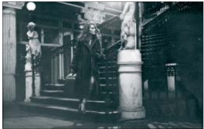
À gauche : Tournage de Lola par Jacques Demy dans le passage Pommeraye... qu'il choisira à nouveau pour son film Une chambre en ville (à droite).

tombent en désuétude. Le passage Pommeraye échappe miraculeusement aux bombardements de 1943, qui endommagent seulement sa verrière. Mais ce n'est qu'aux environs des années 70 que l'on commence à regarder les passages d'un œil différent. Déjà, les surréalistes les avaient remis à l'honneur, attirés par leur côté glauque. Il y a trente ans, on redécouvre ces lieux qui représentent des havres de paix pour les piétons dans les villes envahies par la circulation automobile."